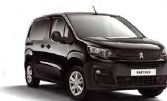
Crna Perla Nera