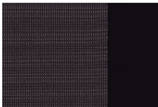
Enterijer Tkanina CURITIBA